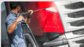
Hochdruck- & Vorsprühreiniger

Hier gehts zur Produkt- und Anwendungsübersicht