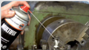
Schmierien | Lösen | Rostschutz