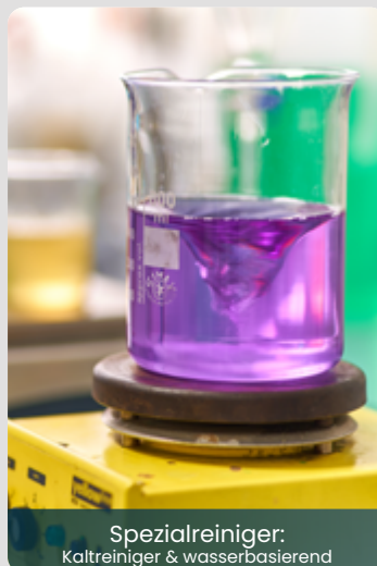
Spezialreiniger: Kaltreiniger & wasserbasierend