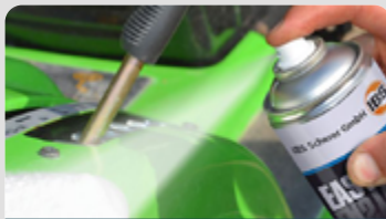
Reinigen | Pflegen | Entfetten