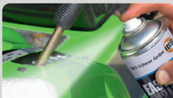
Reinigen | Pflegen | Entfetten