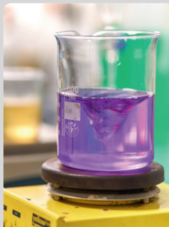
Spezialreiniger: Kaltreiniger & wasserbasierend