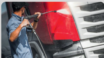
Hochdruck- & Vorsprühreiniger

Hier gehts zur Produkt- und Anwendungsübersicht