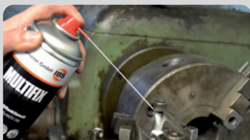
Schmierien | Lösen | Rostschutz